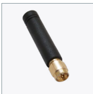
Стержневая антенна Артикул 90035958