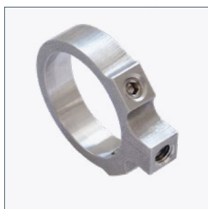
Магнитное удерживающее кольцо (свободно регулируемое на 360°) Артикул 2015069