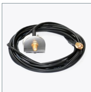
Удлинитель антенны (3м) Артикул 2011249