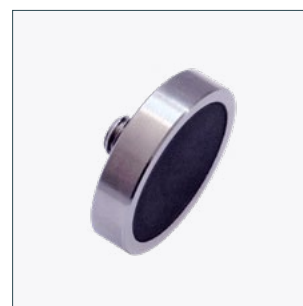
Магнитный адаптер (автоматически входит в комплект каждого регистратора SmartEAR) Артикул 820015167