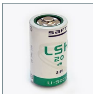
SAFT литиевая батарея Артикул 820007318