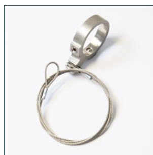
Трос безопасности с магнитным удерживающим кольцом Артикул 2015049