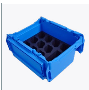
Транспортный ящик с возможностью размещения 10 SmartEAR логгеров с дополнительным отсеком Артикул 2014649